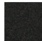
Black Starlight 0337