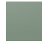
Green Sage 8715