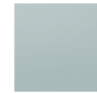
Grey Classic 7035