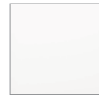
White Pure 9003