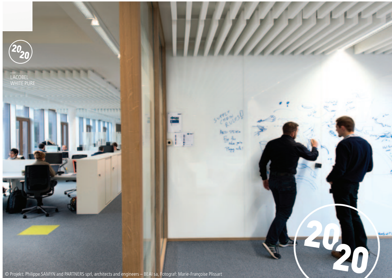
BELGIA KREATYWNA SZKLANA TAFLA, BUDYNEK AGC GLASS, LACOBEL WHITE PURE