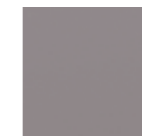
Taupe Metal 0627