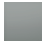
Grey Metal 9006