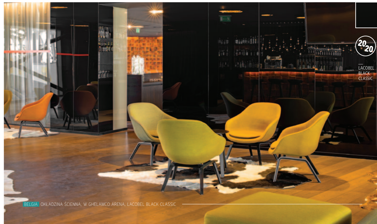
BELGIA OKŁADZINA ŚCIENNA, W GHELAMCO ARENA, LACOBEL BLACK CLASSIC

dzą im nową perspektywę. W wersji Matelac ich elegancki, subtelny urok pozwoli stworzyć kameralną atmosferę. Czerwień Lacobel Red Luminous ożywi wnętrza, a srebrny Matelac Silver Clear doda im wyrafinowanego, spokojnego akcentu.