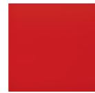
Red Luminous 1586