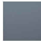
Blue Shadow 7000