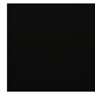
Black Classic 9005