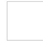
White Pure 9003