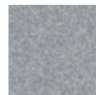
Aluminium Rich 9007