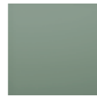
Green Sage 8715