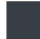
Anthracite Authentic 7016