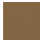
Copper Metal 9115