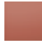
Red Terracotta 8815